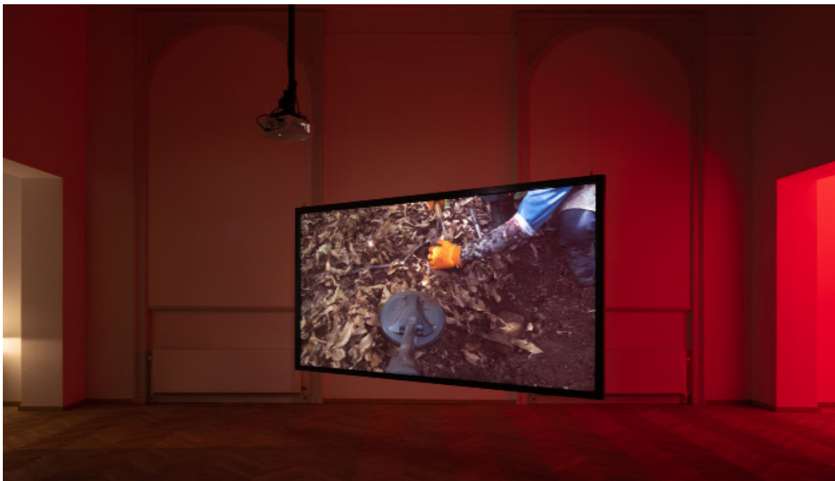
Sweeping the Forest Floor © David Stjernholm

Pour Kaisen, l'île de Jeju est en effet bien plus que « la terre de ses ancêtres », ou une mention biographique. Dans ses autres œuvres, Kaisen s'est intéressée à la spiritualité singulière de l'île, sa cosmologie matriarcale et sa nature, tout en questionnant l'histoire politique et l'importance géopolitique de Jeju. C'est notamment le cas dans ses œuvres portant sur le Massacre et la Résistance du 3 avril sur l'île en 1948. Cet événement s'est déroulé dans le sillage immédiat d'une série d'événements historiques dans lesquels l'idéologie joue un rôle central : départ du colonisateur japonais, guerre froide, partition de la péninsule coréenne.