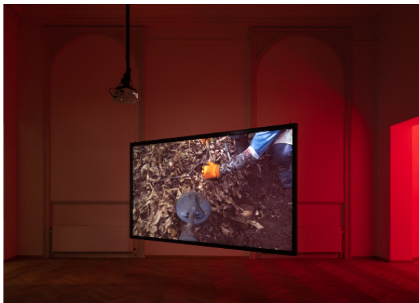
Sweeping the Forest Floor