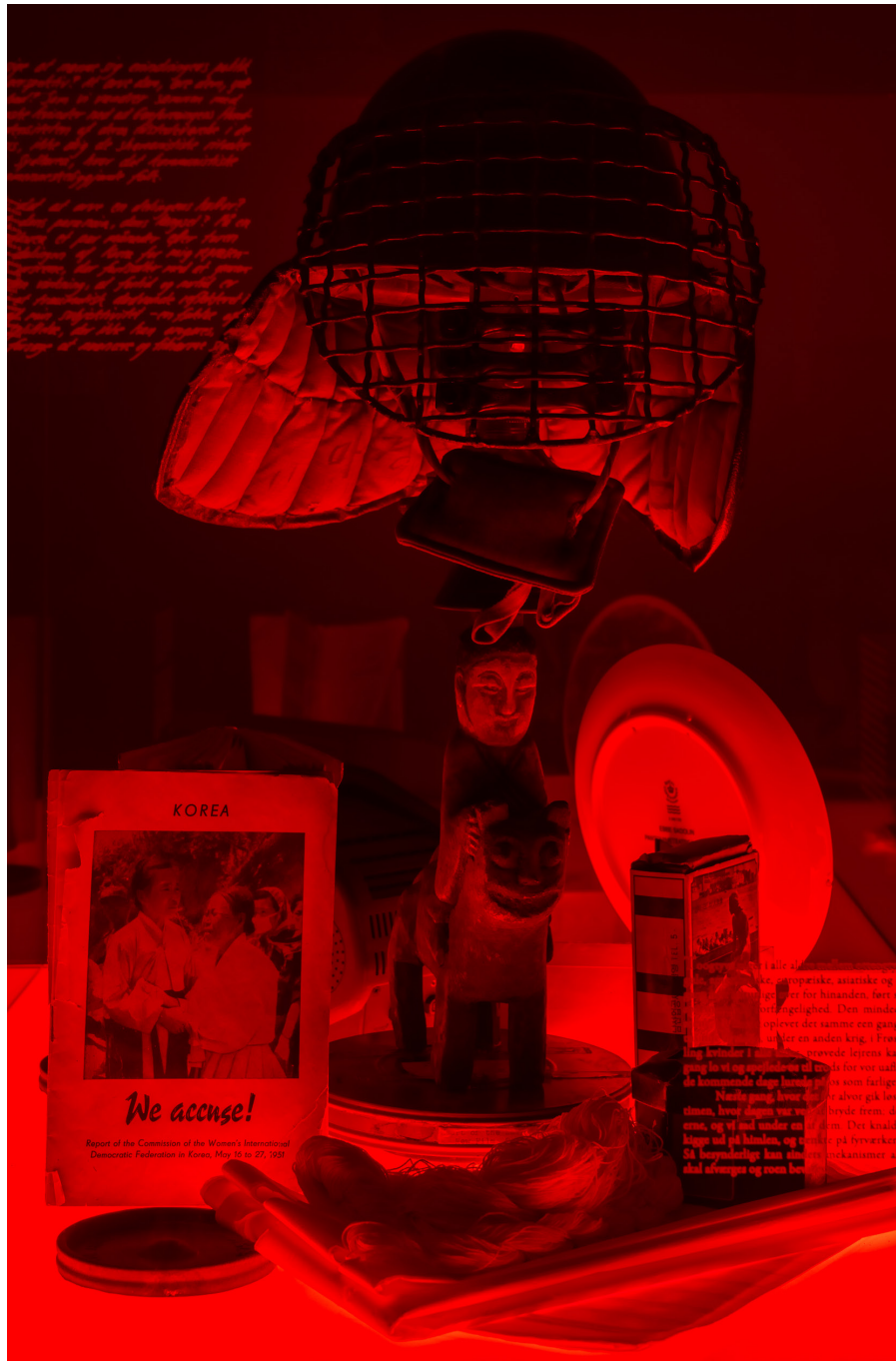
Of Specters or Returns