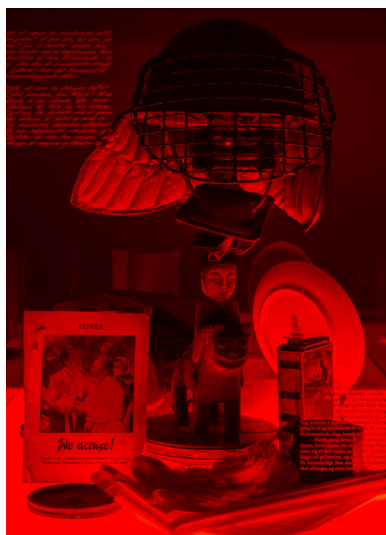
Of Specters or Returns © David Stjernholm