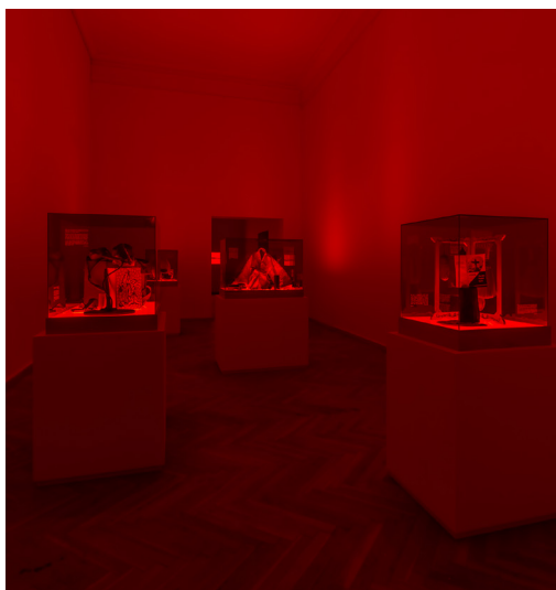
Of Specters or Returns © David Stjernholm