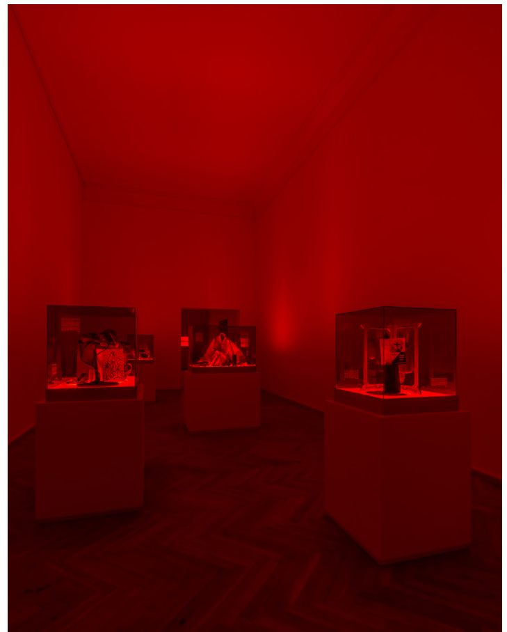
Of Specters or Returns

Dans ses œuvres féministes au visuel fort, à la fois poétiques, polyphoniques et performatives, le passé et le présent entrent en correspondance dans une multiplicité de strates. En appréhendant les sujets de la mémoire, la migration, les frontières et la traduction, elle crée un carrefour entre l'espace de l'expérience vécue et de la connaissance, et celui des histoires politiques à plus grande échelle. Ses œuvres sont une négociation et une médiation de la représentation, de la résistance et de la réconciliation, qui donnent ainsi forme à des généalogies alternatives et des lieux d'émergence collective.